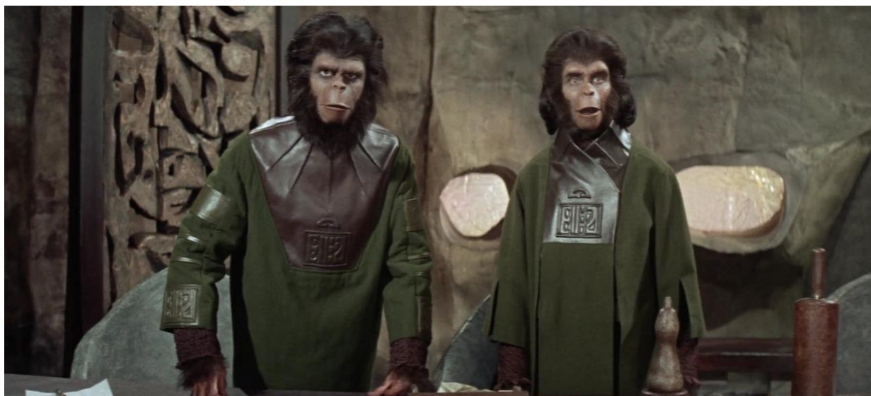
Figura 3 - Dr. Cornelius e Dra. Zira, interpretados por Roddy McDowall e Kim Hunter (76').