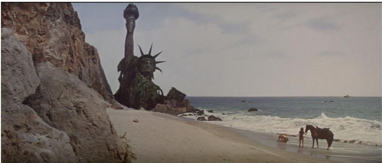
Figura 6 - Taylor e Nova ao encontrarem a Estátua da Liberdade (111’04”).

Depois de uma briga entre os personagens, Taylor e Nova fogem em um cavalo. Então, Taylor, no que é uma das cenas mais famosas do cinema, descobre, ao ver a Estátua da Liberdade, que estava na verdade no planeta Terra, mas num tempo futuro, e que este havia sido dominado e governado pelos macacos quando se deu a destruição da humanidade. Ele então exclama a célebre fala: “Maníacos! Você destruíram tudo! Vão todos para o inferno!” 26