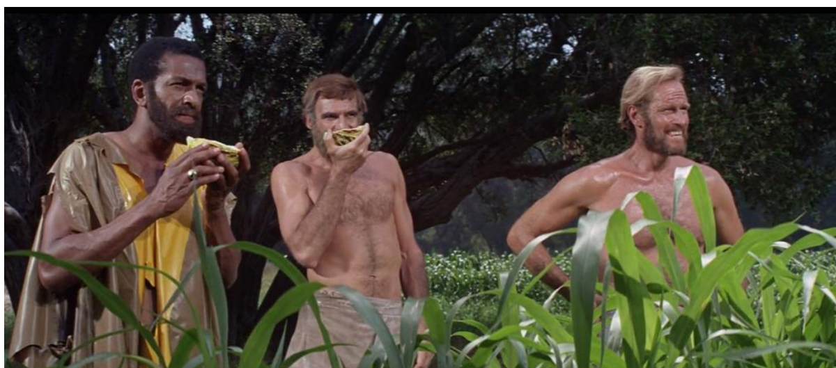
Figura 2 - Os três astronautas observam os humanos selvagens daquele planeta pela primeira vez (30').

Enquanto tomam banho nus no lago, percebem um certo movimento das árvores, e em seguida veem que suas roupas estão sendo roubadas, que, assim como seus equipamentos, são despedaçadas, formando uma trilha, a qual decidem seguir. Num descampado, avistam uma população de seres humanos atacando uma plantação de milho. Eles não falam, nem possuem qualquer tecnologia ou ferramenta. "Se eles são o melhor que há aqui, em seis meses estaremos governando o planeta", diz Taylor (30'53").