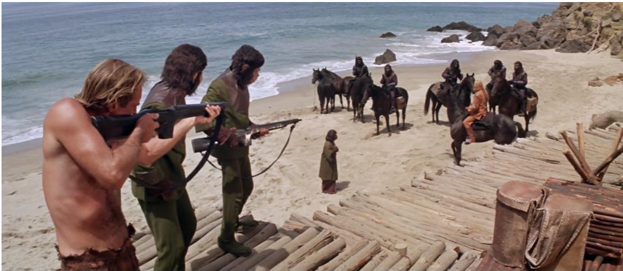
Figura 5 - Personagens na “Zona Proibida”, quando descobrem os artefatos humanos escondidos (91’31”).