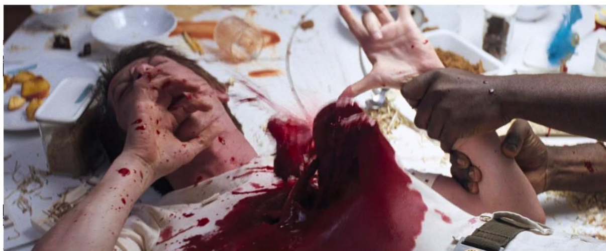
Figura 13 - O alienígena parasita saindo do corpo de Kane. (57’05”).