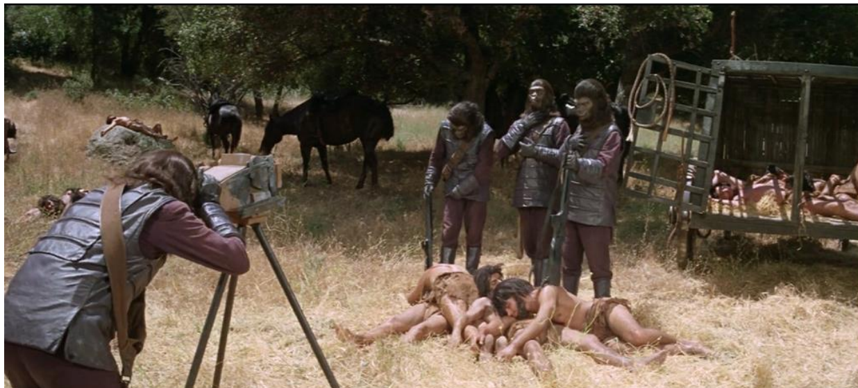
Figura 10 - Os gorilas fotografam a captura de humanos.

de se defender. Até que em seu julgamento a decisão é para que façam experimentos com seu cérebro (73”): você cortou sua cabeça (referindo-se a Landon), tirou sua identidade; e é o que quer fazer comigo!