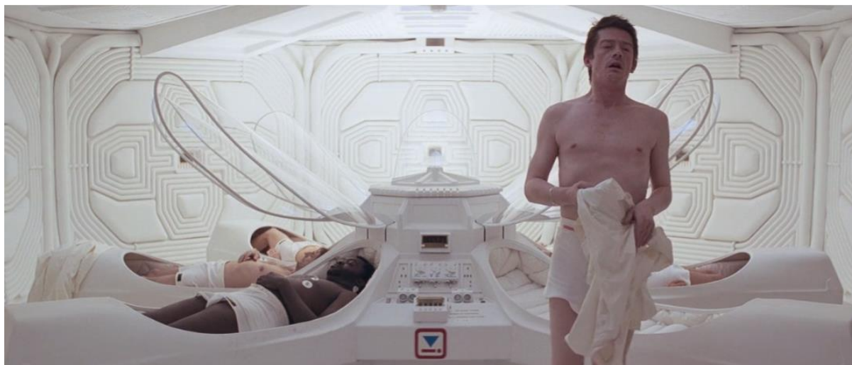
Figura 11 - Kane acordando do sono criogênico. Ao lado, Parker e Brett (6”).