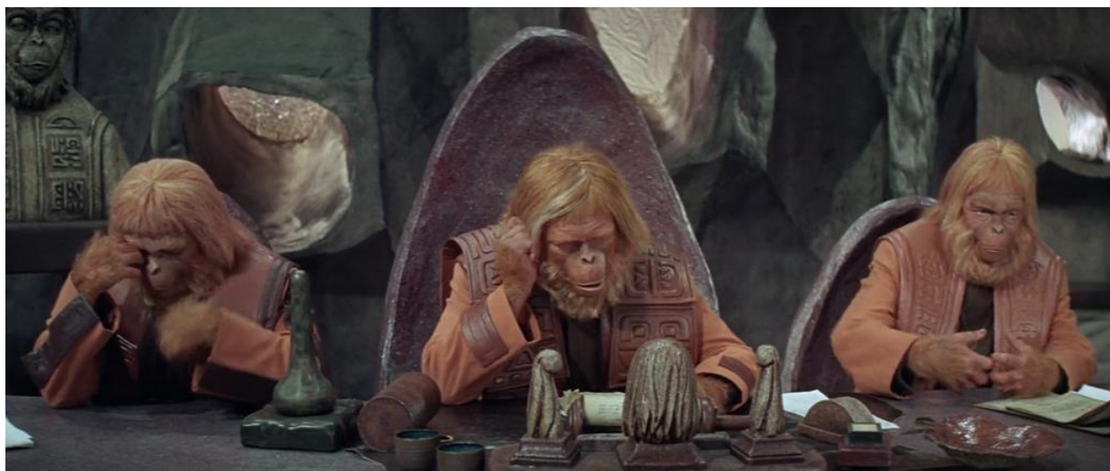
Figura 4 - Dr. Zaius e o conselho, no julgamento de Taylor (75'09").