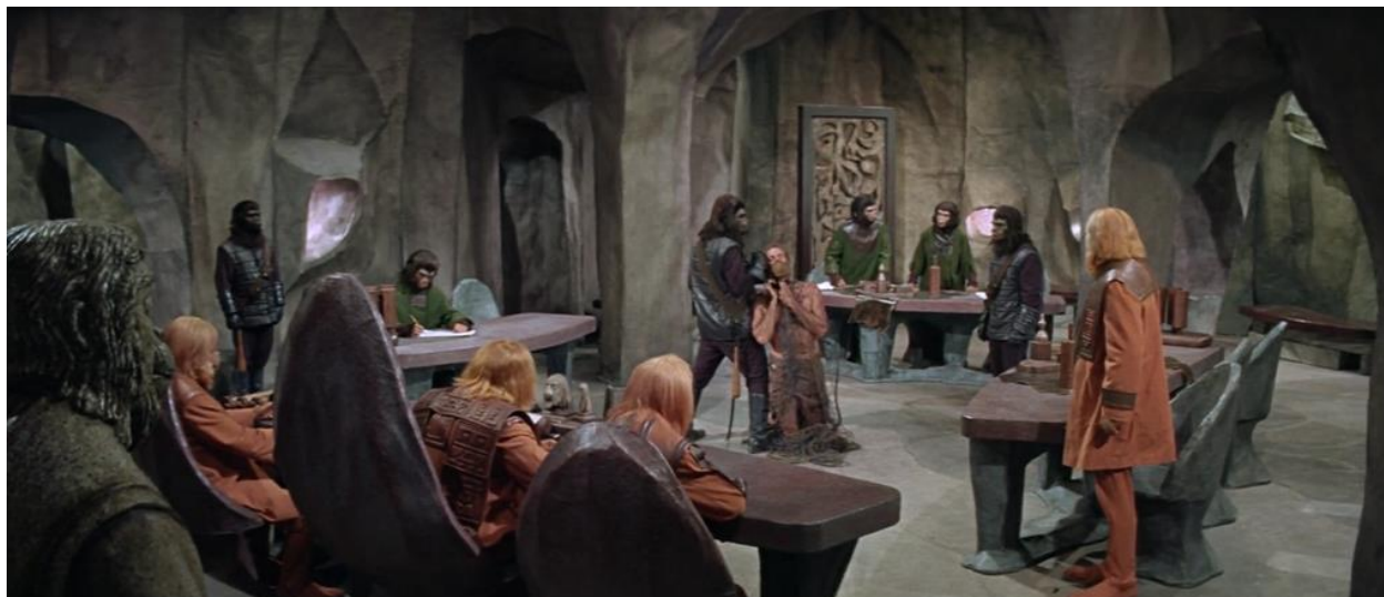
Figura 7 - Taylor é julgado pelos orangotangos enquanto é segurado por um gorila. A Dra. Zira o defende, e podemos ver Cornelius e seu sobrinho ao fundo (74'50").

seriam os policiais ou militares) são os que têm a pele mais escura dentre a população. Os chimpanzés eram os cientistas.