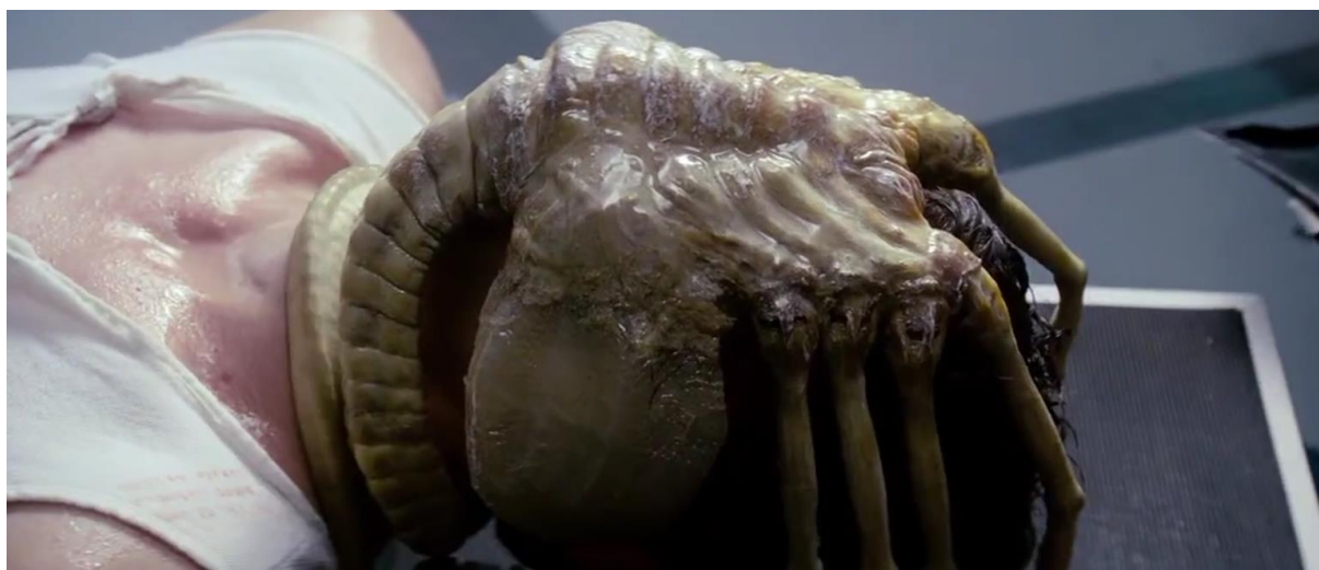
Figura 12 - O “facehugger” (37’36”).