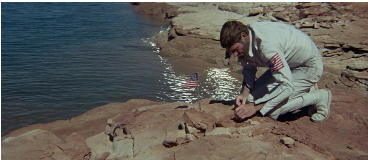
Figura 8 - Landon registra a chegada de astronautas americanos ao novo planeta (15'05").

e a bandeira nesse caso simboliza a sua conquista, ou então a de uma tentativa de se fazer lembrar, num local de exclusão como o do filme.