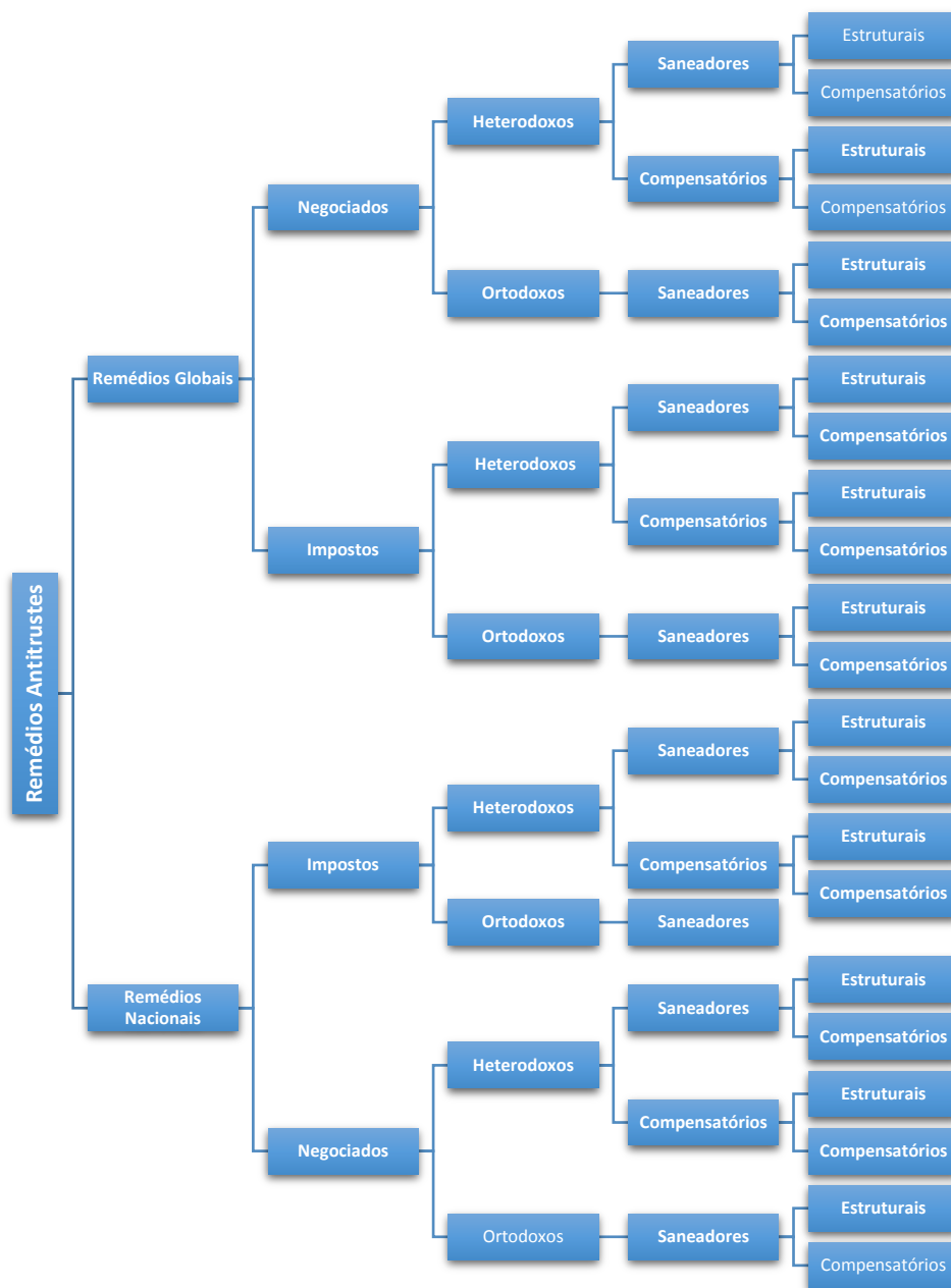
Fig. 2 – Fluxograma dos Remédios Antitrustes