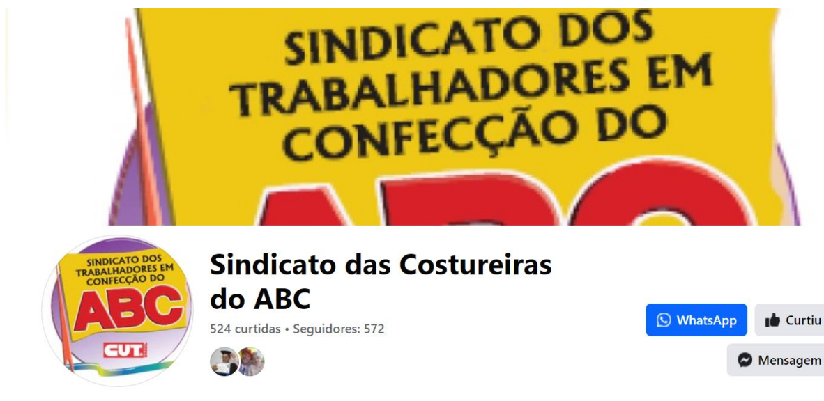
Imagem 1: Print Screen da página no Facebook do Sindicato