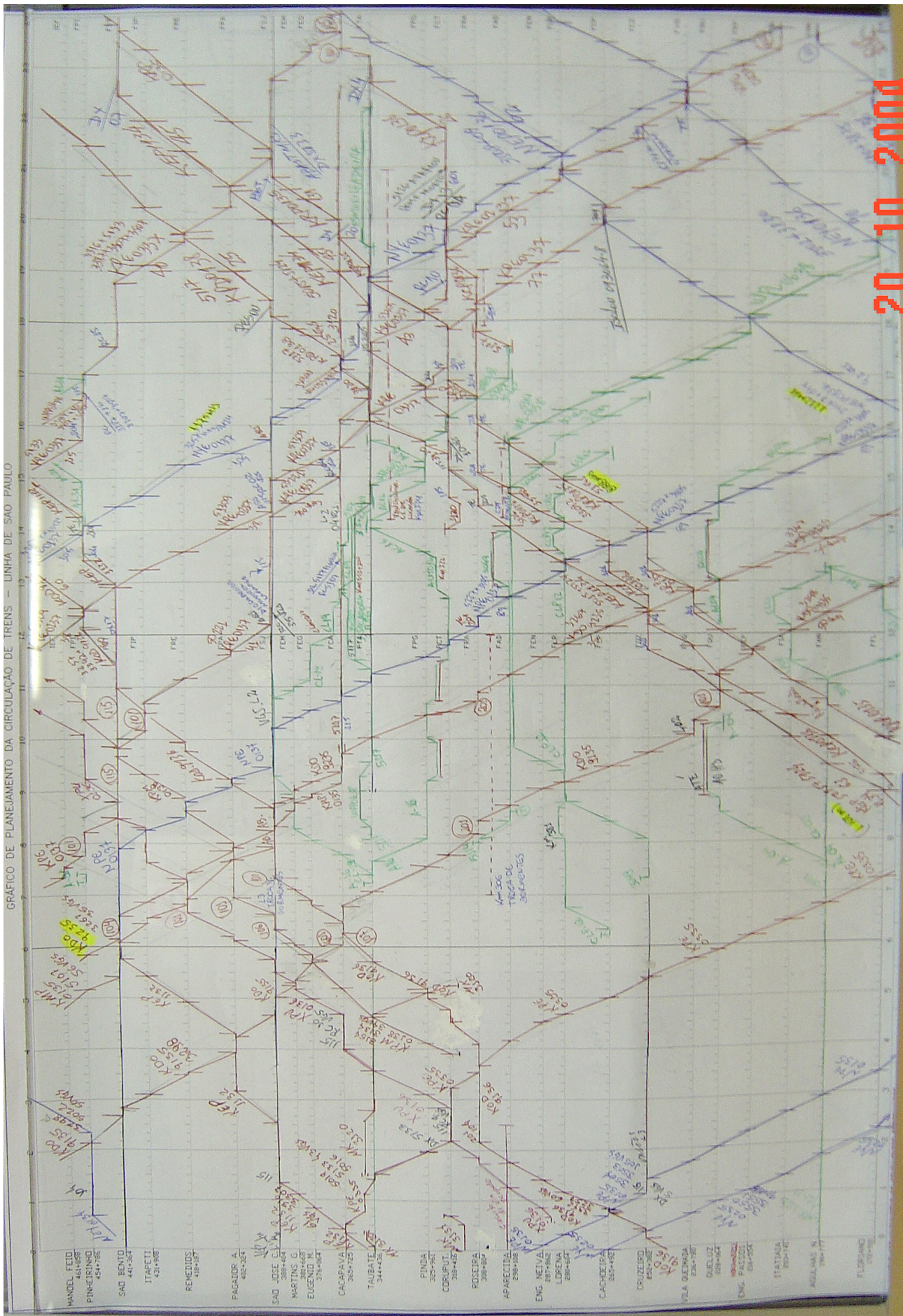
GRÁFICO DE PLANEJAMENTO DA CIRCULAÇÃO DE TRENS - LINHA DE SÃO PAULO