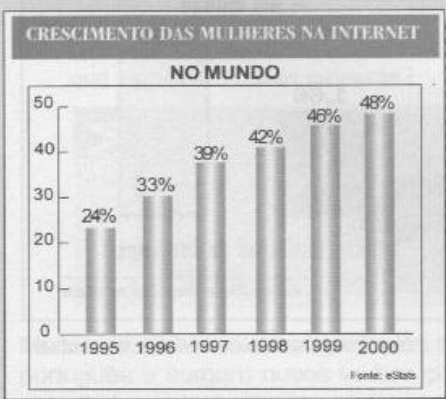
GUIA DA INTERNET.BR, Ediouro, Rio de Janeiro, ano 2, n. 22, p. 39, mar.1998.

Este, compara valores e representa quantidades através dos tamanhos das barras horizontais ou verticais.