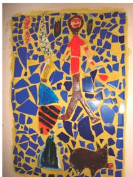
Montagem com o fotem de G. e o super-herói de J. A. no painel de mosaico