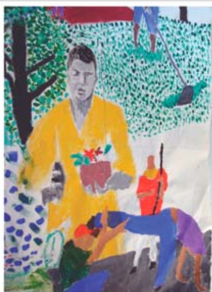
Cena da capoeira e da "macumba" no painel de pintura