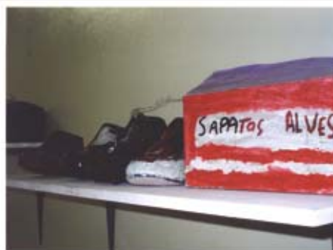
"Sapatos Alves", parte do projeto "Os sapatos"