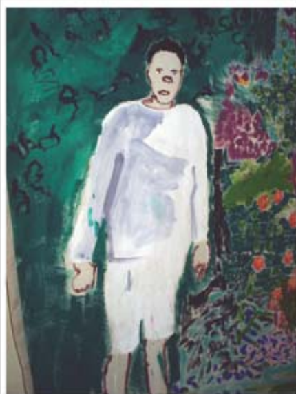
Imagem do "Anjo Guerreiro" pintado por D no painel de pintura