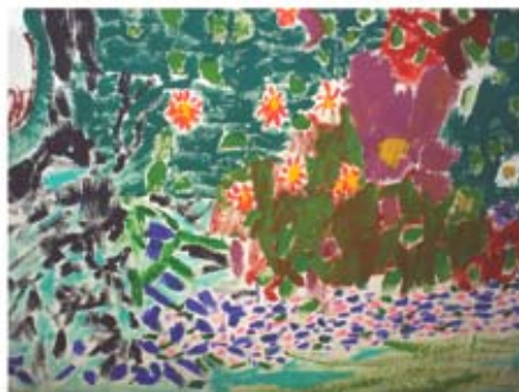
Parte do jardim de M pintada por M A e D