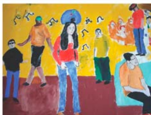
figura 08/ p. 136

Imagem do detalhe do rosto de MA no painel de pintura