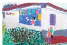
figura 09/A p. 139

A creche em que M trabalhava no painel de pintura