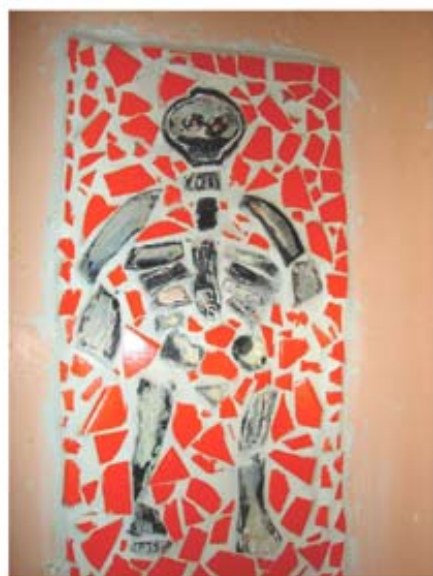
figura 18/ p. 205

Pratos de cerâmica que adornam o painel de mosaico, criação coletiva