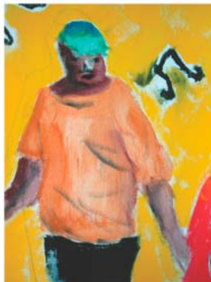
figura 21 p. 225

Imagem de M na pista de dança no painel de pintura