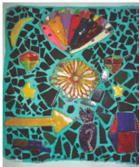
Montagem com as pips de G. no painel de mosaico