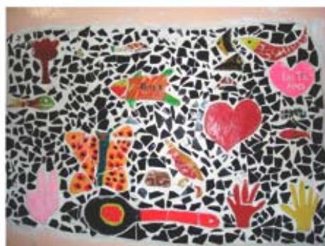
Montagem com grandes peças de cerâmica no painel de mosaico