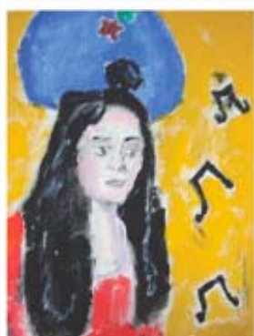
figura 07/ p. 130

Imagem do detalhe do rosto de MA no painel de pintura