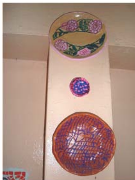
figura 17/ p. 184

Pratos de cerâmica que adornam o painel de mosaico, criação coletiva