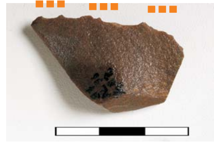
Lamela de arenito silicificado, com menos de 50 do córtex, com talão presente e esmagado e com retoques.