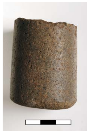
Mão-de-pilão polida de basalto