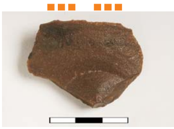
Lasca de arenito silicificado, com menos de 50% do córtex, com traços de utilização, o talão é diedro com retoques.