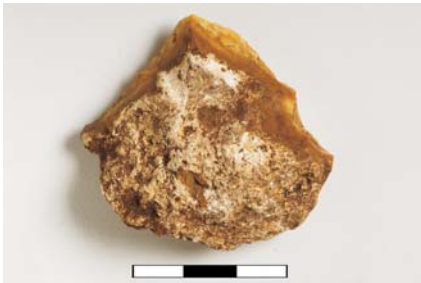
Raspador de sílex.