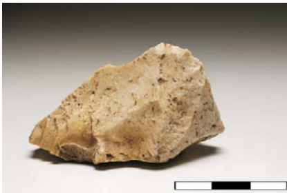
Plano convexo de sílex.