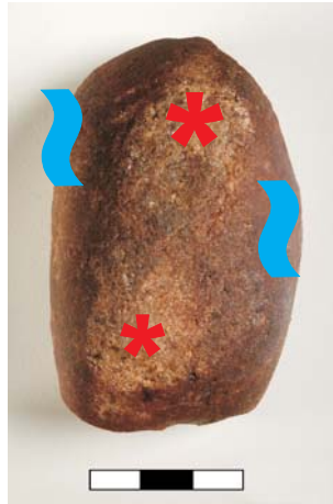
Percutor muito utilizado, de quartzo, com marcas de uso e marcas de polidor. Instrumento duplo.