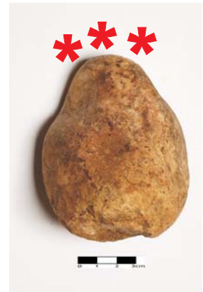
Percutor de quartzo.