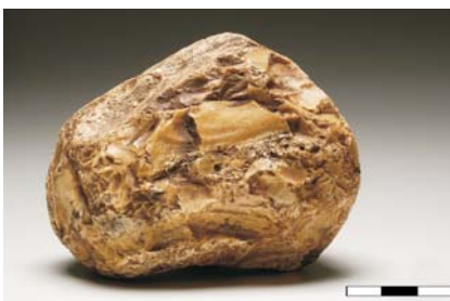
Núcleo de sílex