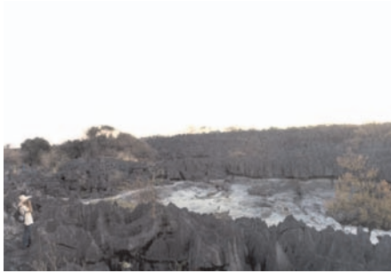
Caldeirão Verde - dolina de dissolução em campo de lapiás