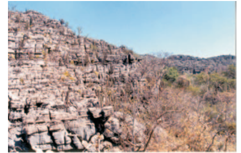
Afloramento da região do Morro da Lapinha