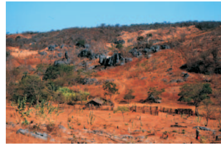
Aflorescimentos residuais em encosta sedimentada