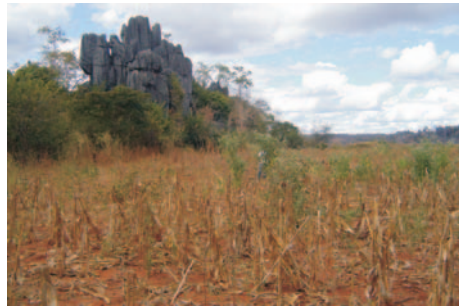
Afloramento residual (Sítio Cerâmico do Leônidas)