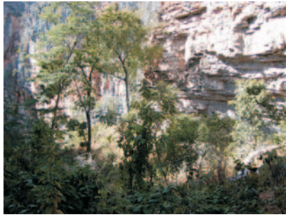
Cânion do Morro Furado