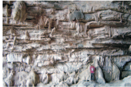
Espeleotemas da Gruta-túnel do Morro Furado