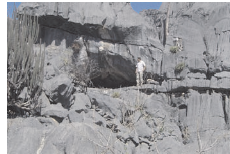
Relevo ruiforme (Nicho do Tatu)