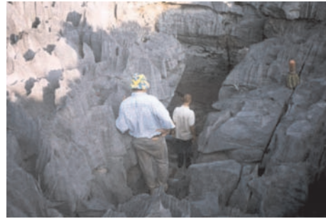
Fenda vertical afogada