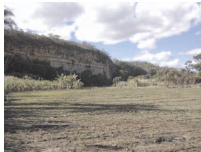
Escarpa às margens do Carinhanha