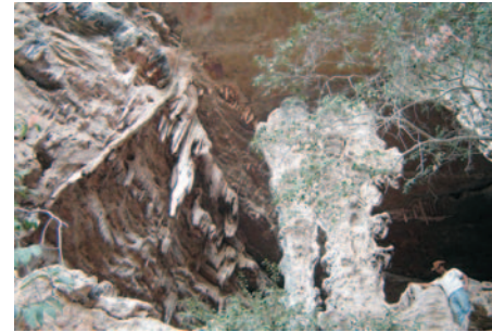
Gruta da Mamona