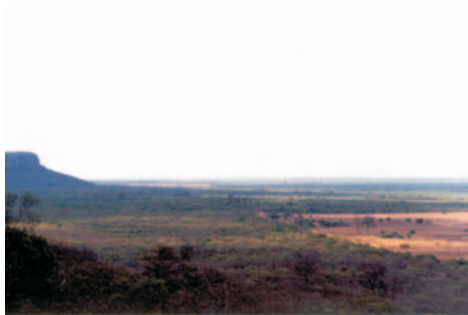
Depressão Sanfranciscana e morro residual à esquerda (Serra do Cipó)