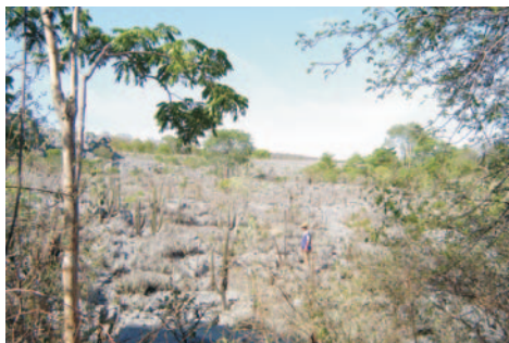
Campo de Lapiás da Serra da Pitarana