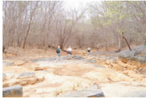
Leito seco do córrego da Bananeira (Serra do Aristeu)