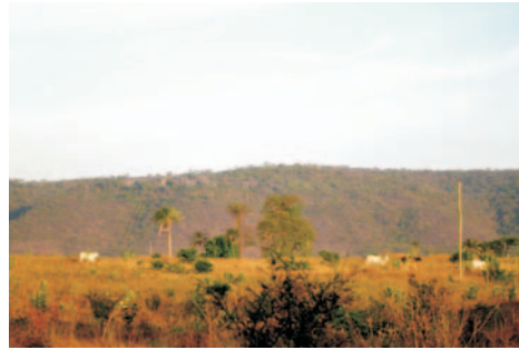
Serra da Pitarana, margem esquerda do rio Cochá