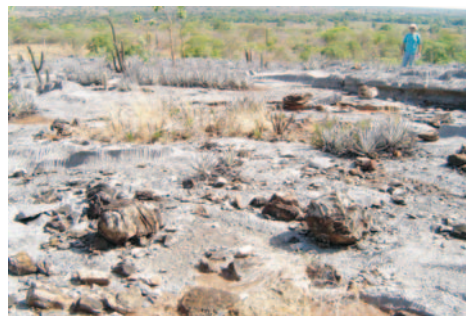
Blocos desagregados de sílex em campo de lapiás - Serra da Pitarana