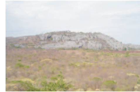
Depressão do rio Cochá e afloramento da Lapa do Possêidon (lado N) ao centro