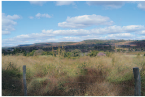
Depressão do rio Carinhanha, ao fundo, à esquerda, relevo de mesas