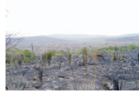
Região da Lapa do Possêidon