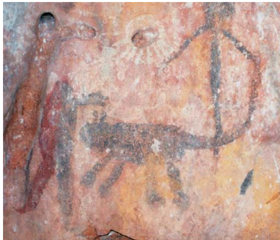
Figuras em preto do momento P3A

Prancha 20 - Lapa do Gigante Planta baixa, cortes topográficos e crono-estilística relativa das pinturas e gravuras