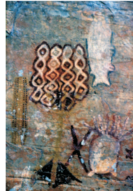
Prancha 46 - Afinidades estilísticas entre figuras São Francisco e Montalvânia