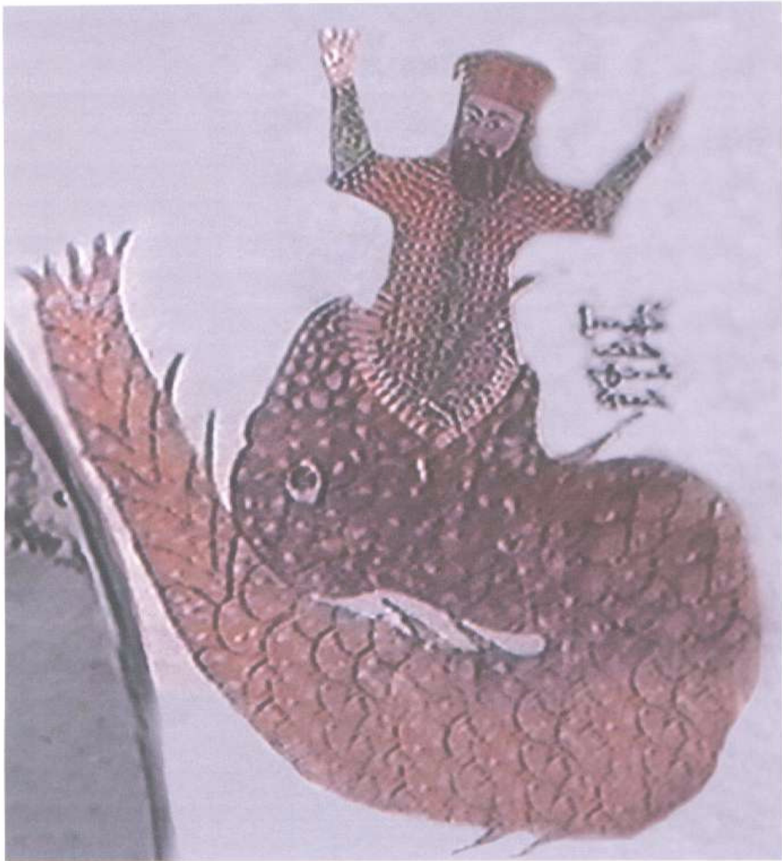
Jonas sendo engolido pelo peixe. Afresco da Igreja Síria Ortodoxa de São Jorge. Sadad, Síria central. Fonte: Documentário em VHS: "The Hidden Pearl" by Trans World Film Italia srl, Syrian Orthodox Church, Syriac Universal Alliance, 2001.