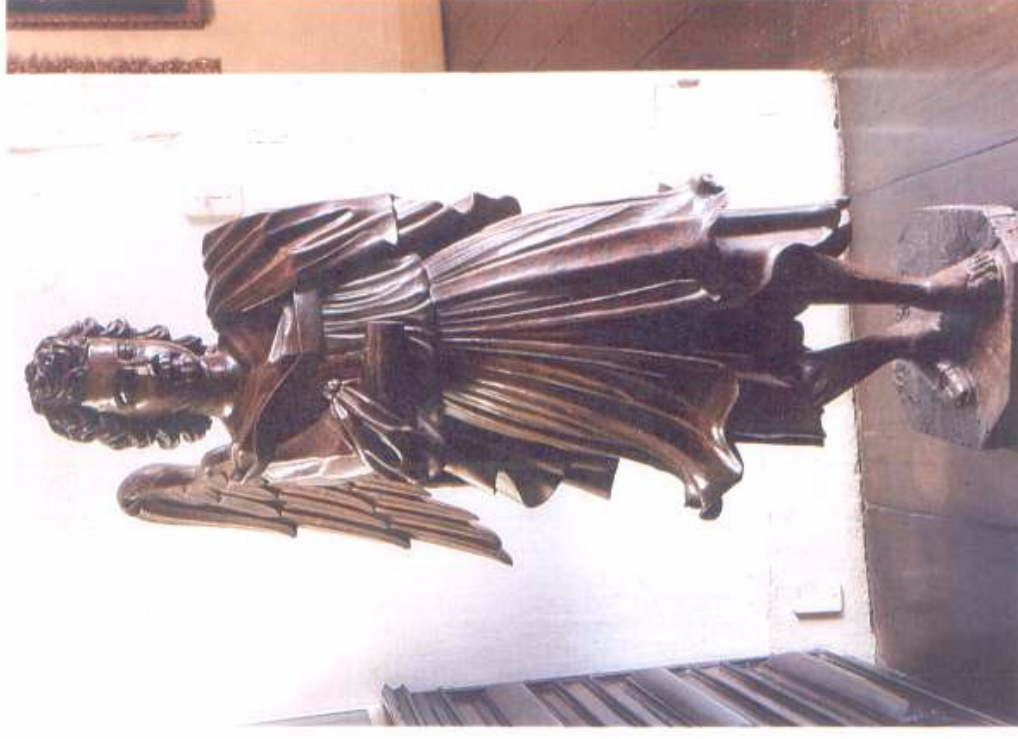
Anjos Tocheiros da Matriz de Santo Antônio de Ouro Branco, Séc. XVIII. Ouro Branco, MG. In: Museu Arquidiocesano de Mariana. MAM. Fonte : Marezza Photo. Mariana, 2004.