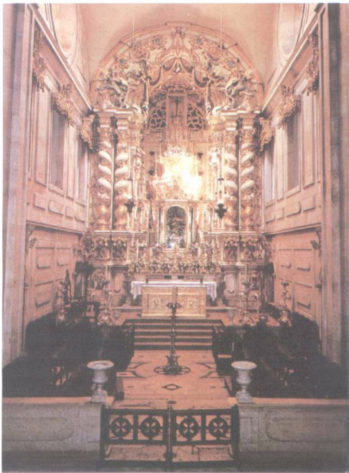
Altar-mor da Basílica de N. Sra. da Conceição da Praia. Salvador, BA.